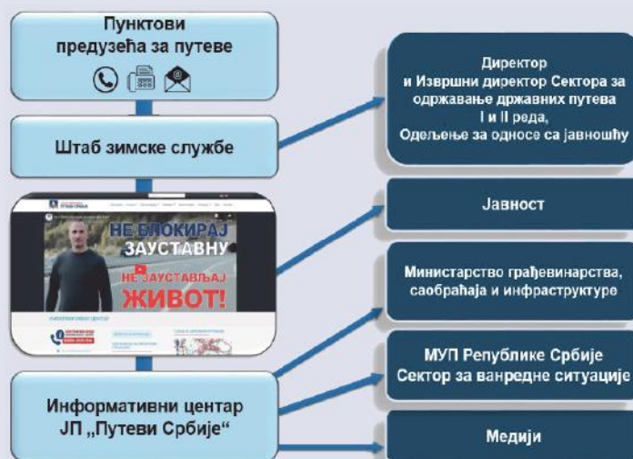
Систем обавештавања и информисања медија и свих заинтересованих