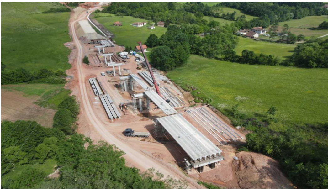
ЛОТ 1: Вијадукт