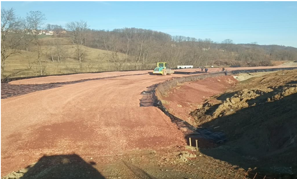
ЛОТ 1: Потпорна конструкција од армиране земље