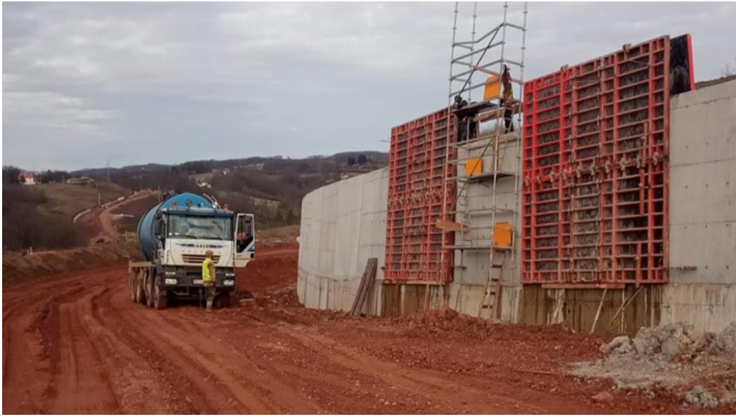
ЛОТ 1: Армирано-бетонски зид